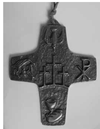
Geschenk für die Konfirmierten im letzten Jahr: Kreuz mit Konfirmationspruch

ternommen, waren z.B. im Bibelmuseum und in der Nieder-Ramstädter Diakonie. Nicht zu vergessen die großartige Konfifreizeit und das Passionsspiel, bei dem wir richtig Spaß hatten, gemeinsam ein Theaterstück auf die Beine zu stellen. Ein Lob muss hier mal an unsere tollen Konfiteamer ausgesprochen werden, die sich so viel Mühe für uns gemacht haben. Ich kann nur eins sagen: Es lohnt sich!“