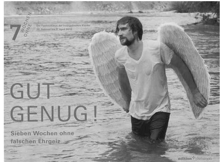
Motto der Aktion 7 WOCHEN OHNE